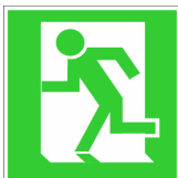
Fluchtweg- hinweis 2